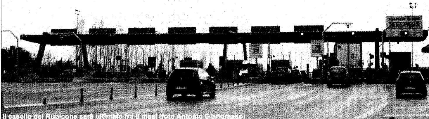
Il casello del Rubicono sarà ultimato tra 8 mesi